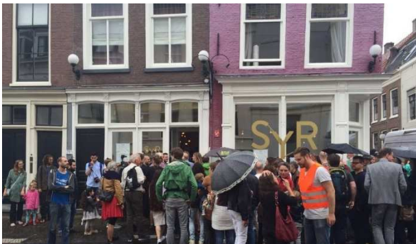
Opening restaurant Syr