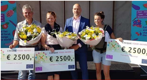
Voedselinitiatieven ontvangen Food Award