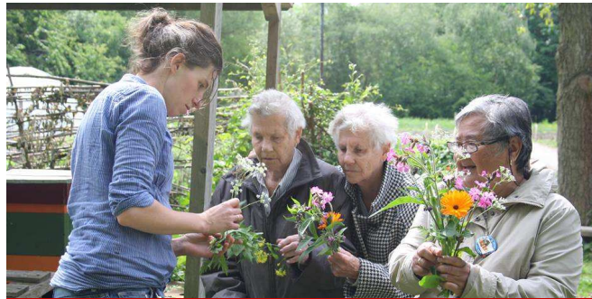
Ouderen in het groen bij Food For Good