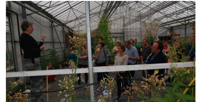
Voedselvraagstukken in stadsgesprekken