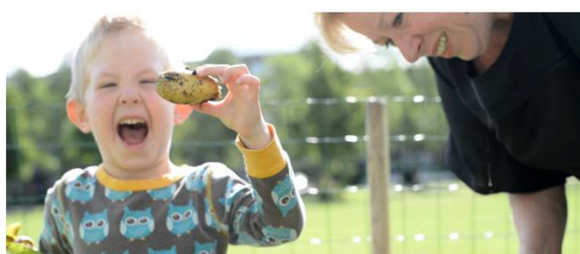
Kinderen leren over voedsel in peutermostuintjes