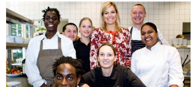
Opleiden van werklozen bij de Colour Kitchen