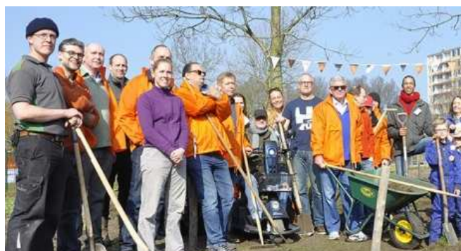
NL DOET bij Voedseltuin Overvecht