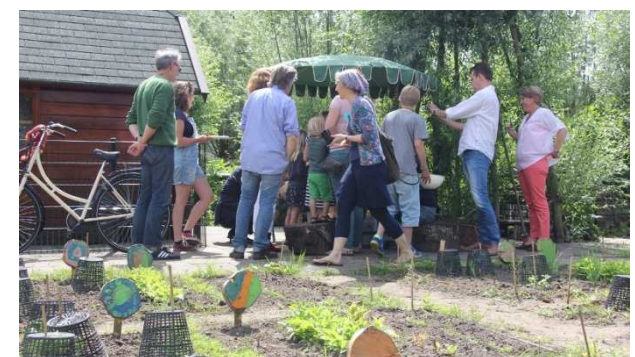
Groen Moet Je Doen Dag op volkstuin Ons Buiten