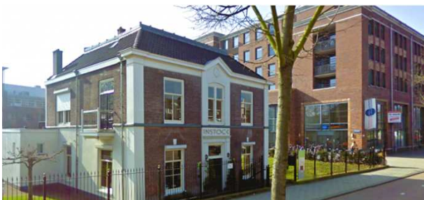
Voedselverspilling op de kaart bij InStock